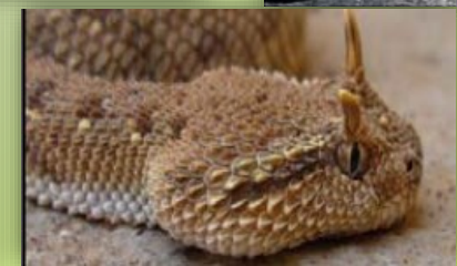
مار شاخ دار ایرانی